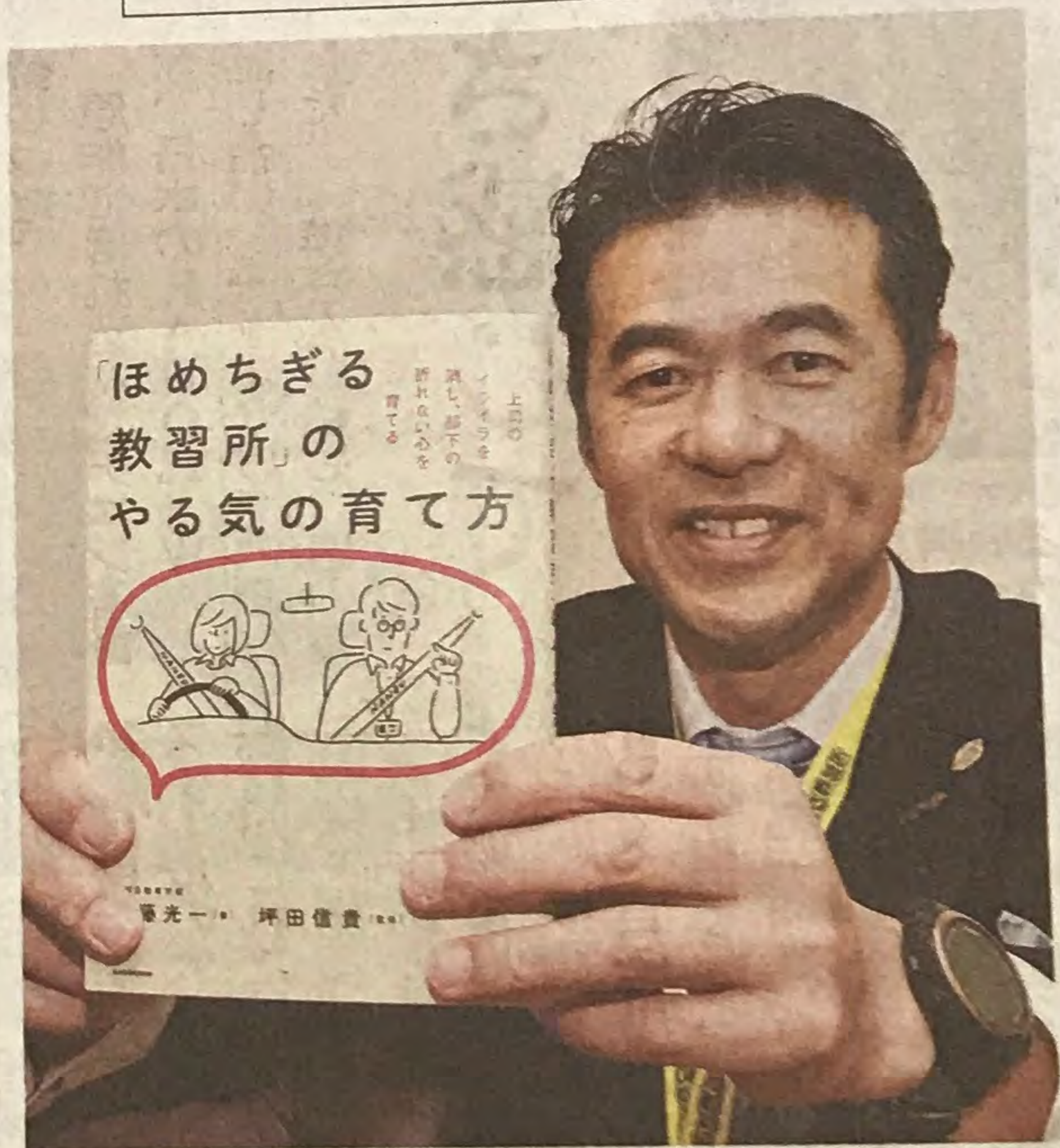
5年間のノウハウをまとめた本＝伊勢市小俣町の南部自動車学校で